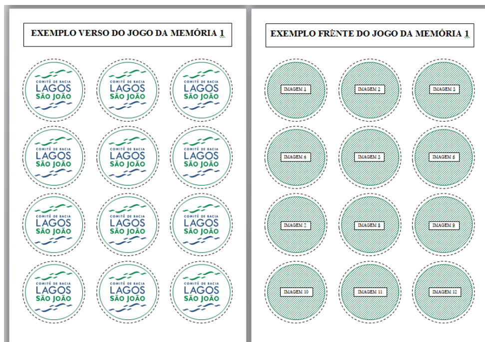
Figura 2. Esquematização do Jogo da Memória.

6.1.1.3. A Revista de Atividades deverá apresentar na contracapa as logomarcas do Comitê de Bacia Hidrográfica Lagos São João (CBHLSJ), do Consórcio Intermunicipal Lagos São João (CILSJ), da Secretaria Estadual de Ambiente e Sustentabilidade (SEAS), do Instituto Estadual do Ambiente (INEA), do Fundo Estadual de Recursos Hídricos (FUNDRHI) e do Governo do Estado do Rio de Janeiro.