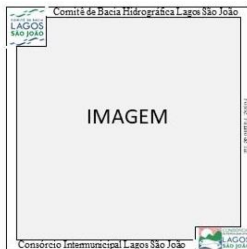
Figura 3. Modelo dos ímãs

6.1.2.1. Os ímãs deverão atender as especificações do item 5.2.2 e seguir os modelos da Figura 3. Os ímãs devem apresentar a logomarca do CBHLSJ e do CILSJ. As imagens serão fornecidas pelo CILSJ.