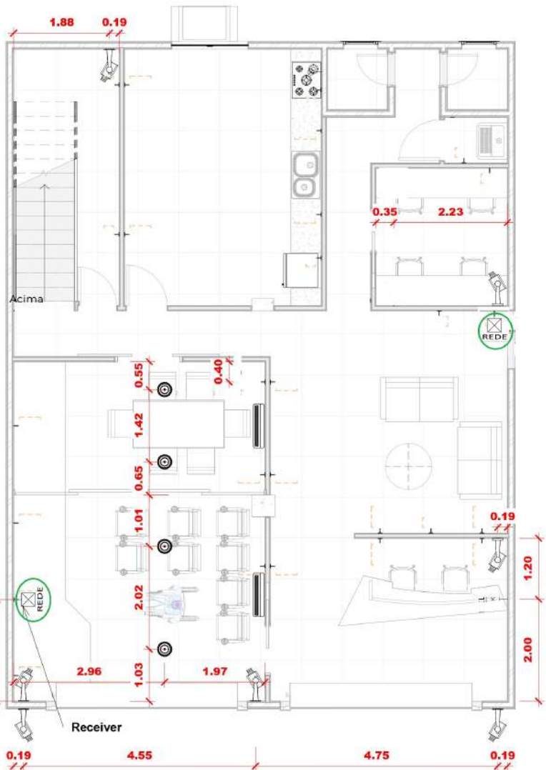
1 Sistemas - Térreo 1 : 75