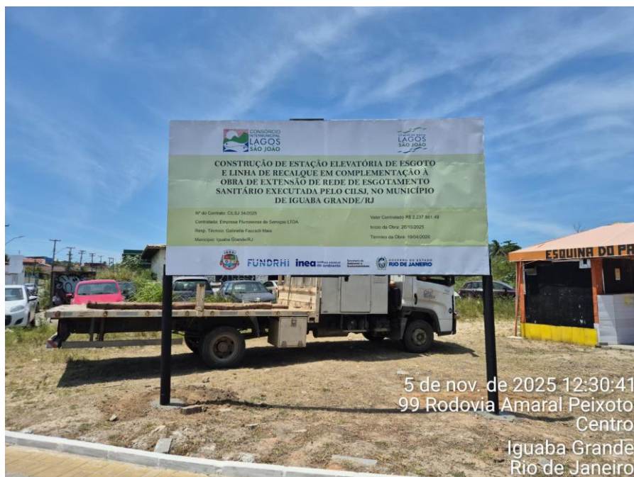
Figura 3 Modelo para confecção da placa.

Consórcio Intermunicipal para Gestão Ambiental das Bacias da Região dos Lagos, do Rio São João e Zona Costeira. CNPJ nº 03.612.270/0001-41