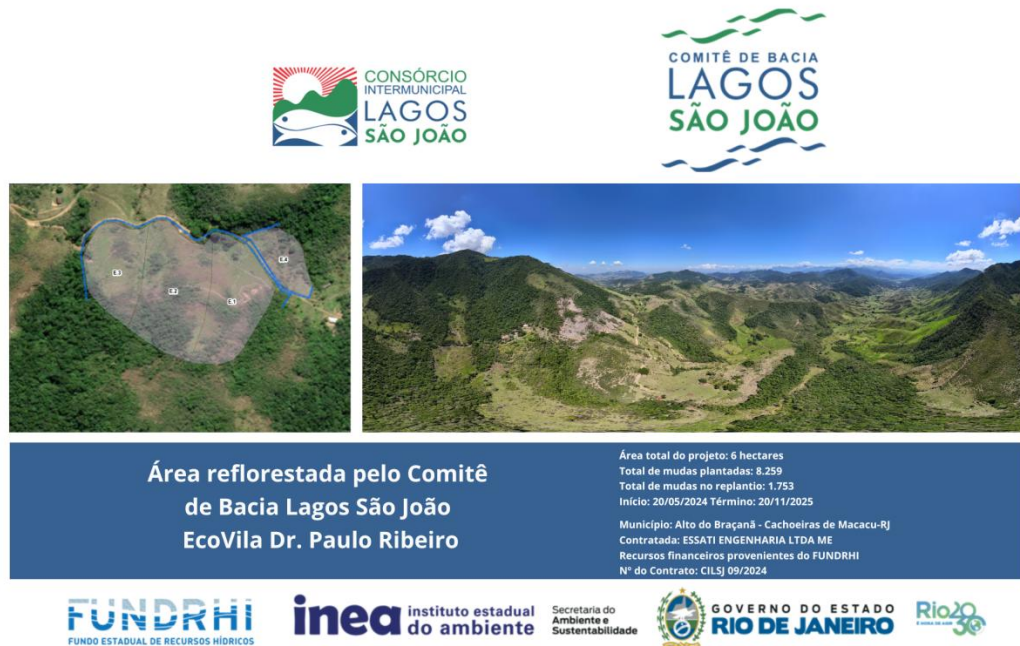
Figura 2 Sistema Gráfico da placa informativa.